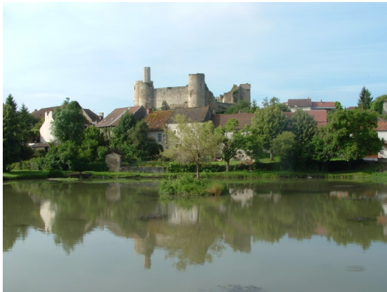
A - Étang